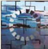
Port de Llançà